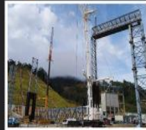
Montajes industriales Industrial assemblies