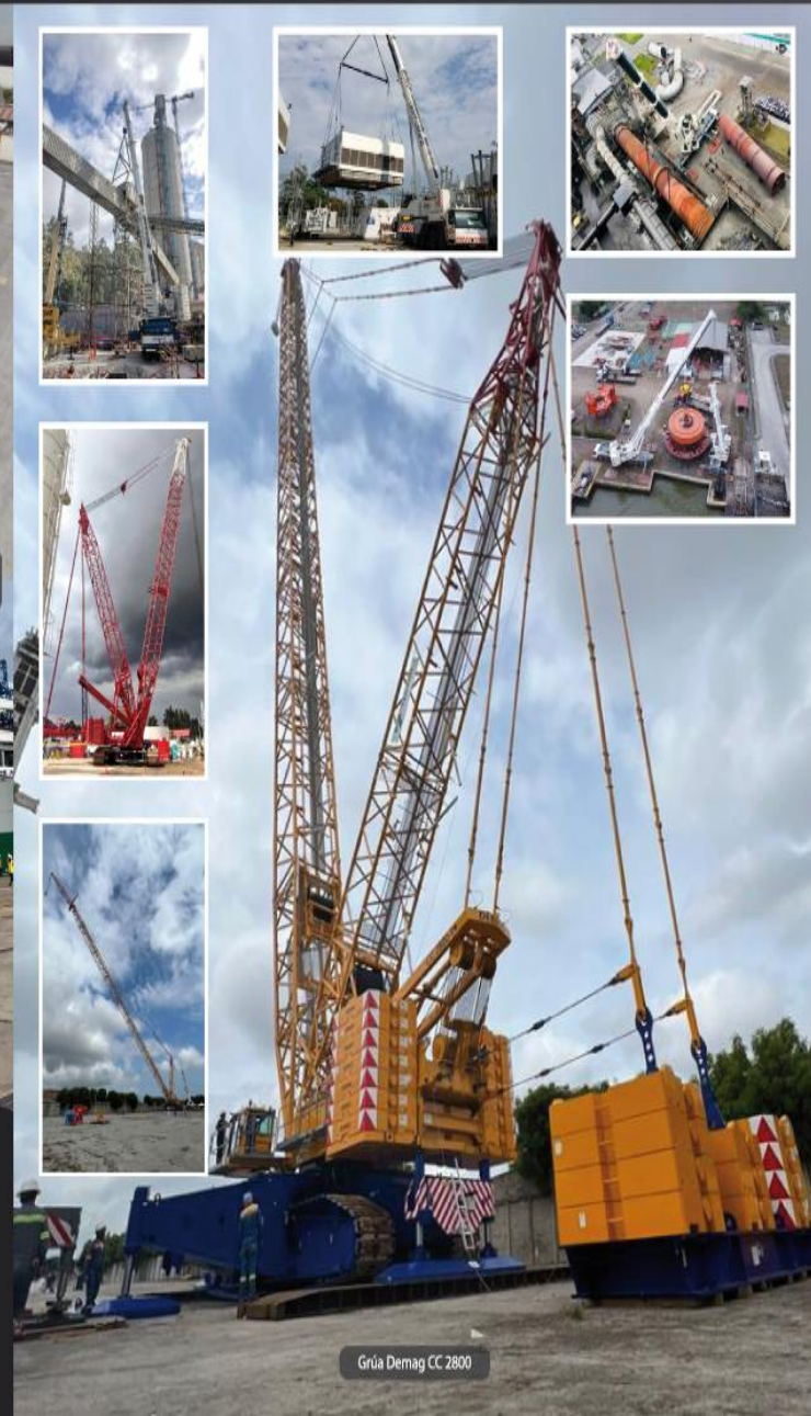
Grúa Demag CC 2800