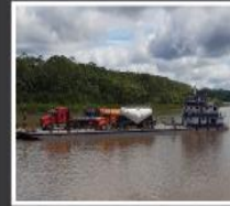
Transporte fluvial (gabarras y botes) River transport (barges and boats)