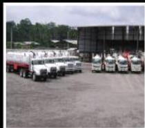
Equipos de succión al vacío (vacuums) Fluids transport and vacuum services