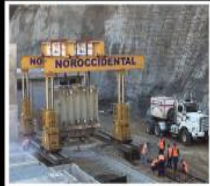
Grúas pórtico tipo gantry Gantry cranes