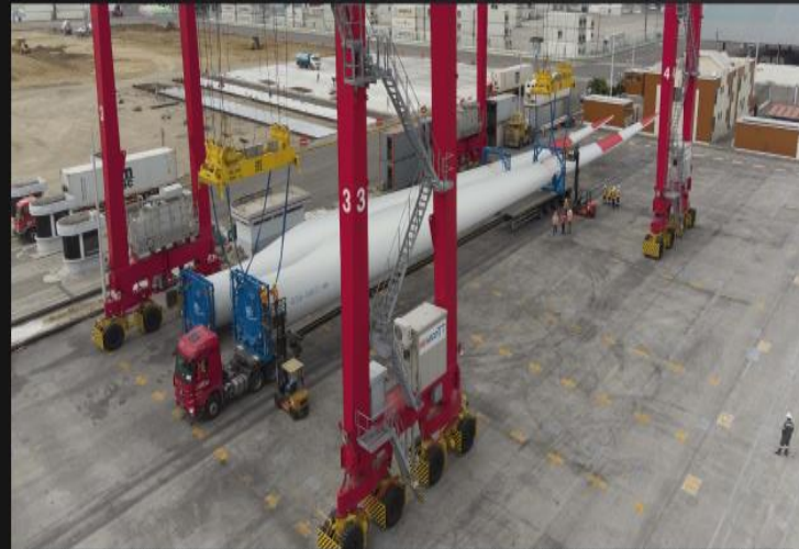
Equipo para transporte e izaje para proyectos eólicos (plataformas extensibles, modulares hidráulicos, bladeflifter y grúas sobre oruga narrow track) / Transport and lifting equipment for wind energy projects (extendable platforms, hydraulic modulars, bladeflifters and lattice boom crawler cranes and narrow track cranes).